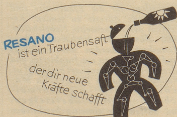
Zu beziehen durch Mineralwasserdepots

Kurz ist sein Wesen stets, er kann nicht schöne Worte machen, er sieht dich nur durchbohrend an, als trügst du gestohlene Sachen.