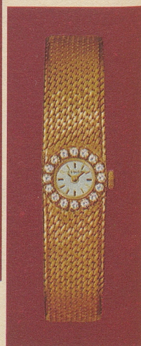
GX 401126 Gold 18 Kt. 16 Brillanten Fr. 2'230.-