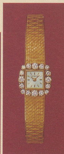
GX 401148 Gold 18 Kt. 16 Brillanten Fr. 3'600.-