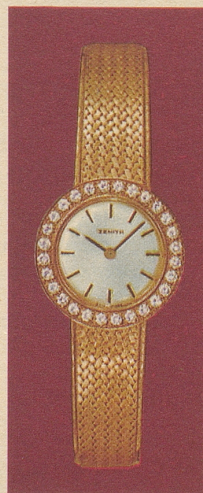
GX 401157 Gold 18 Kt. 28 Brillanten Fr. 2'780.-

Uhrenfabriken ZENITH S.A., Le Locle/Schweiz