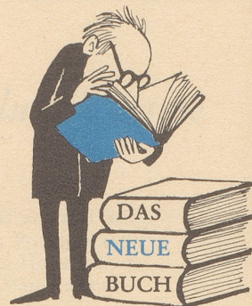
Ein Silberstreifen mit Silberbüchern

DIE EINZIGE MARKE * DIE 1966 * IHREN VERKAUF VERDOPPELTE