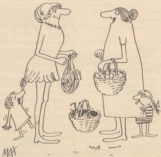
Opfer der Mode