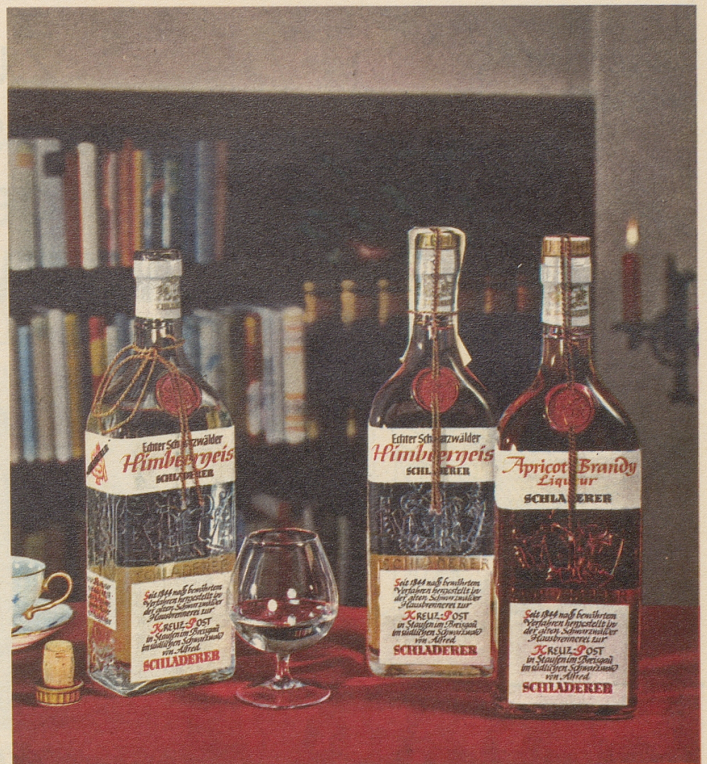
SCHLADERERS echter Schwarzwälder Himbeergeist und Apricot

Schon der Duft verheisst höchsten Genuss – das vollkommene Aroma übertrifft Ihre Erwartungen!