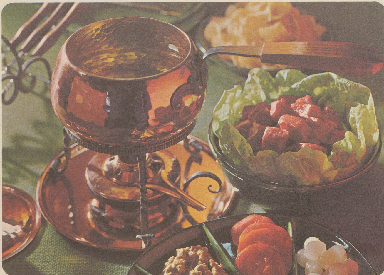
Fondue Bourguignonne – Burgunder Fondue-Garnitur (Burgunder Pfanne, 18 cm Ø, mit Deckel, Réchaud, Tablett) Nr. 7707, Fr. 86.50. Pfanne für Fondues oder alle Arten von Beilagen verwendbar. Réchaud geeignet für Burgunder Pfannen und für die türkische Kaffeepfanne.