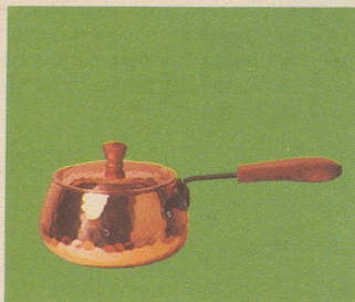
Burgunder Pfanne, 14 cm Ø, mit Deckel, Nr. 7705, Fr. 34.50, 18 cm Ø Fr. 44.–, für Fondues und Beilagen.