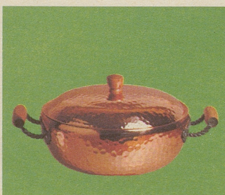
Pot-au-feu mit Deckel, Nr. 7835, Fr. 71.–, für Fleisch-, Fisch- oder Geflügel-Eintopfgerichte oder für Suppen.