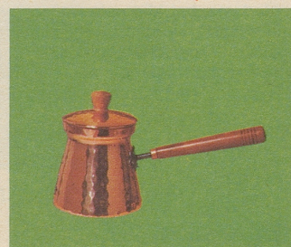
Türkische Kaffeekanne mit Deckel, Nr. 7911, Fr. 29.30, für echt türkischen Kaffee.