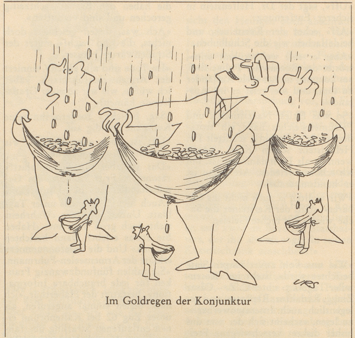
Im Goldregen der Konjunktur

das Basel von heute sein. Die Originalunterschriften samt einem Begleitbrief gingen inzwischen dem kanadischen Ministerpräsidenten Lester B. Pearson zu mit der Bitte, acht Minimalforderungen zur Humanisierung der Seehundemetzgerei zu verwirklichen. Wir wollen einmal sehen, ob die kanadische Regierung merkt, wie sehr die Seehundekindermorderei alle anständigen Menschen davon abhalten wird, der Weltausstellung in Montreal einen Besuch abzustatten ... Inzwischen aber liegen die Berichte, vermehrt um einen Filmstreifen und Diapositive, von der Seehundemetzgerei 1966 vor. Sie stammen nicht von irgendwelchen Reportern, denen die finanziell interessierten Kreise Sensationslust vorwerfen können. Sie stammen von offiziellen Beobachtern, die von der kanadischen Regierung unter dem Druck der Weltmeinung zugelassen waren und geschützt wurden. Der Schutz bestand zwar vorwiegend daraus, daß die Polizeikräfte die beiden offiziellen Beobachter am Beobachten und schon gar am Photographieren und Filmen hinderten. Aber immerhin — gerade deshalb kann niemand mehr dahergelügen, die beiden hätten keine Dokumente mitgebracht, sondern Fälschungen und gestellte Szenen. Daß sie trotz aller Behinderung ihrem Auftrag und ihrem Gewissen folgten, stellt ihrem persönlichen Mut ein schönes Zeugnis aus. Jeder Tierfreund, und jeder nicht seelisch verrohte Mensch überhaupt, wird ihnen dafür Dank wissen.