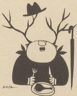
Kulinarisches Jägerlatein im: