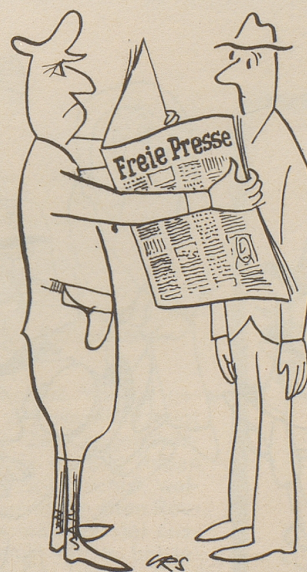
Zeitungsleser in Griechenland

Das bayerische Finanzministerium will mit aller Gewalt eine Neuauflage von Hitlers «Mein Kampf» verhindern, und zwar nicht aus fiskalischen Gründen, sondern zur Wahrung des deutschen Ansehens im Ausland. Bravo und viel Erfolg! Daß daneben ein paar Kampf-Besitzer nicht unglücklich sind, wenn ihr treu gehütetes Adolf-Werk im Antiquariat nicht zu billig wird, wollen wir hier nur am Rande vermerken.