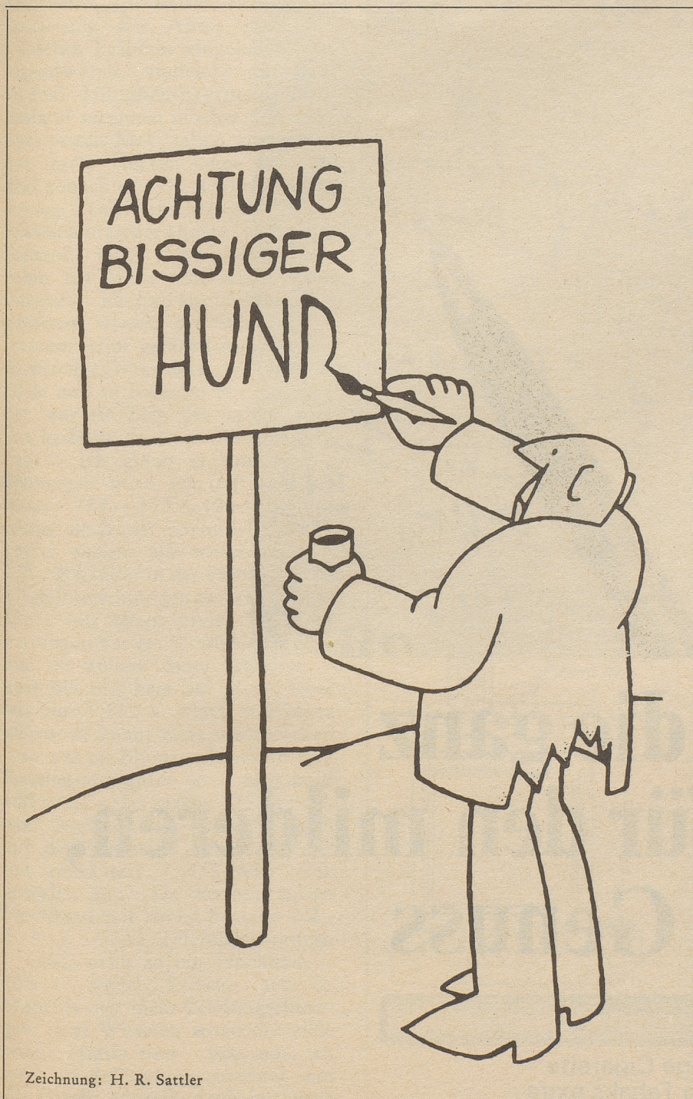
Zeichnung: H. R. Sattler

Ein Vorschlag, welcher es wert wäre, geprüft zu werden, und zwar nicht nur in der Ostschweiz!