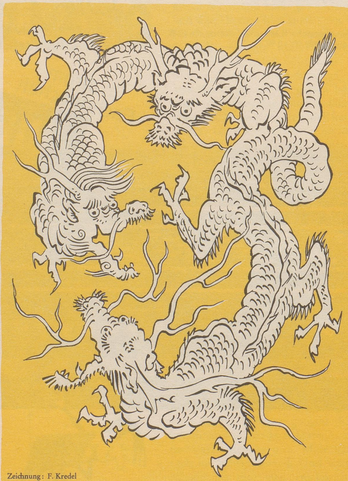
Zeichnung: F. Kredel

Der chinesische Drachen weiß nicht mehr, wo ihm der Kopf steht.