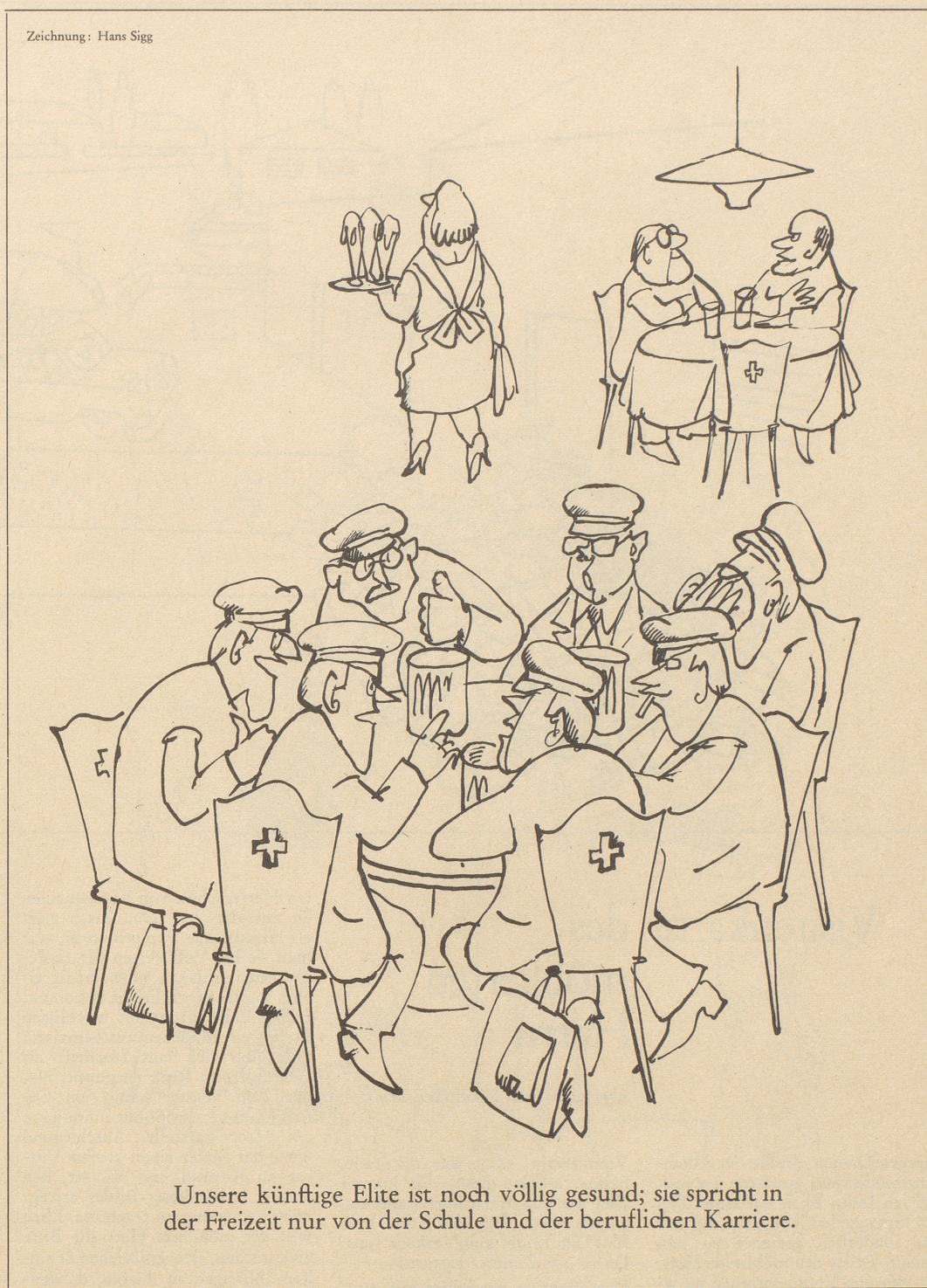
Unsere künftige Elite ist noch völlig gesund; sie spricht in der Freizeit nur von der Schule und der beruflichen Karriere.