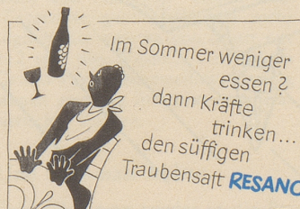
Hersteller: Brauerei Uster

Wenn Sie wissen wollen, wie die ideale Baslerin ist: sie ist blond, hat sehr viel fraulichen Charme und wohnt im Kanton Baselland. Außerdem kommt sie aus Zürich.