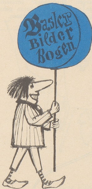
Von Hanns U. Christen

Um die Kochkünste der idealen Baslerin und Anwärterin auf den Titel der idealen Schweizer Frau und Anwärterin auf was-weiß-ich-noch-alles zu prüfen, wurden den Kandidatinnen unerhörte gastronomische Probleme zu lösen aufgegeben. Die eine Hälfte der Damen mußten jenes Gericht zubereiten, das zu genießen man in der Schweiz selbst an heißen Augusttagen arglos zugereiste ausländische Freunde zwingt, die weder Käse noch Knoblauch gernhaben, und das Fondue heißt. Die andere Hälfte der Da-