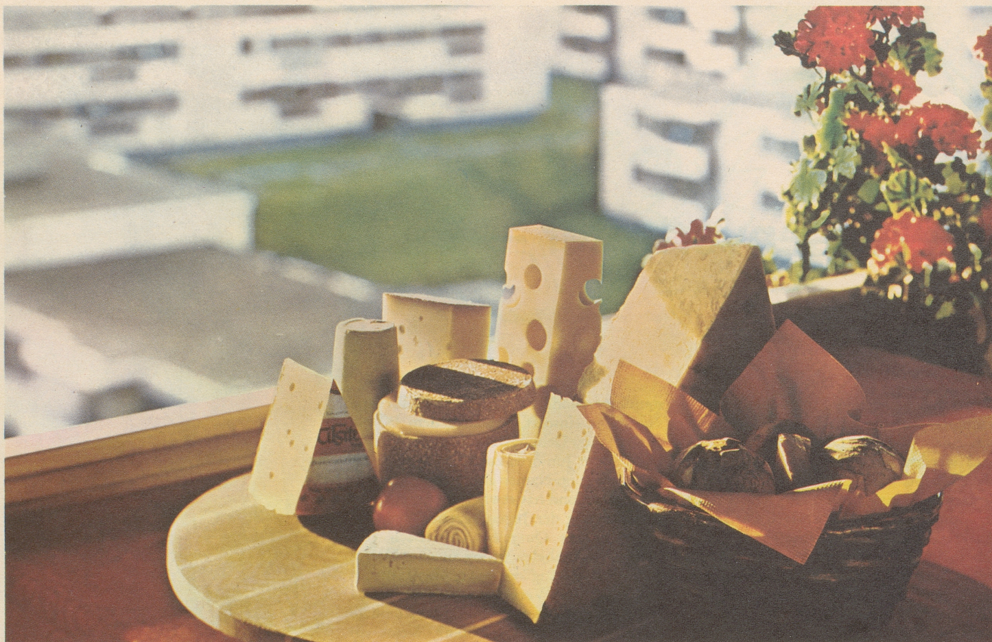
Marken-Tilsiter, Schabziegér, Brie suisse, Tête de Moine, Greyerzer, Hobelkäse, Emmentaler, Walliser Alpkäse, Sbrinz