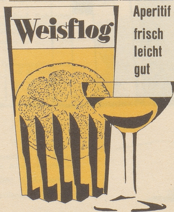
G. Weisflog & Cie. 8048 Zürich-Altstetten

Die Abnutzungsschärmützel auf technischer Ebene schleppen sich nun schon seit langen Monaten hin.