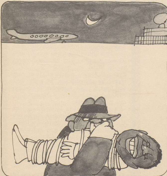
Moïse Tschombé entschließt sich, Ferien in Algerien zu machen.