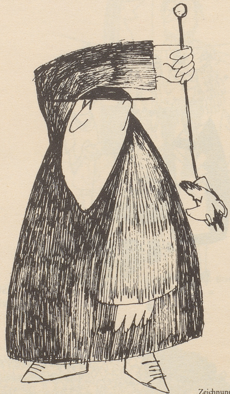
Zeichnung: Jürg Furrer