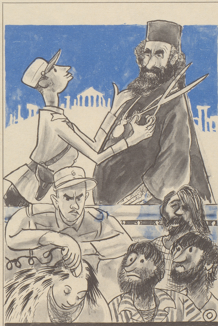
Zeichnung: A. M. Cay

Das Eintrittsgesuch Englands zur EWG oder: Das Problem der Britannia im Minirock: Verbeugt sie sich vor Europa, so zeigt sie Amerika den Allerwertesten ...!