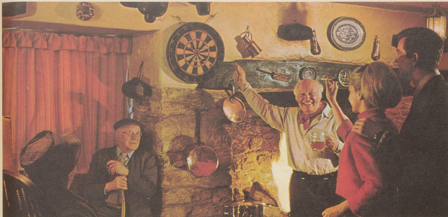
Wirtshaus in Torbryan, Devon.