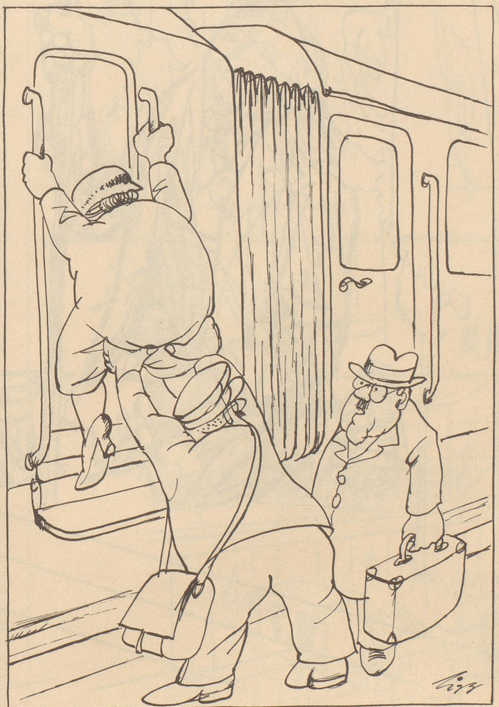
Auf gewissen Stationen erfordert das Besteigen eines Eisenbahnwagens akrobatische Fähigkeiten.

« Hoffetlich wäred d Trittbrätter nöd au na erhöht! »