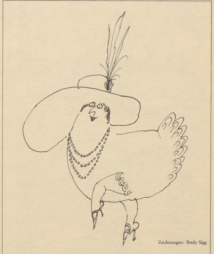
Zeichnungen: Fredy Sigg