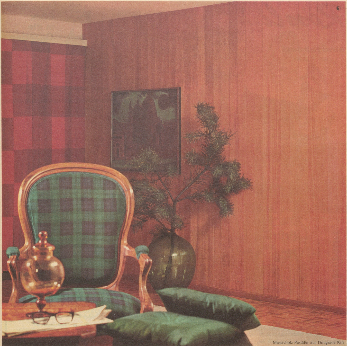
Massivholz-Fastäfer aus Douglasie Rift