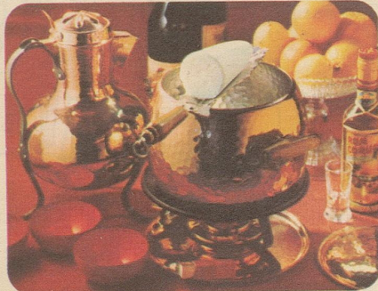
Krumbambuli. Stöckli-Modelle: Bowle mit Deckel 7745, Fr. 73.50, Réchaud 7531, Fr. 27.50, Zange 7973, Fr. 16.-