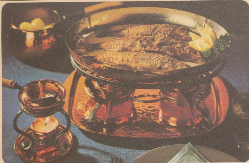
Felchen «Seestern». Stöckli-Modelle: Flambierpfanne oval Nr. 7771, Fr. 55.-, Réchaud mit Tablett Nr. 7569, Fr. 80.50, Saucenwärmer Nr. 7575, Fr. 29.90, Burgunder-Pfanne mit Deckel Nr. 7705, 14 cm, Fr. 34.50.