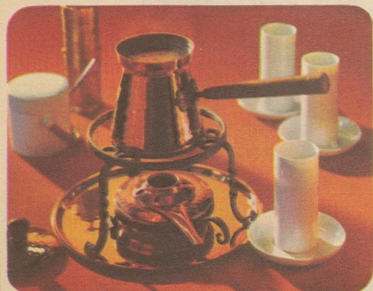
Café turc. Stöckli-Modelle: Mocca- und Kaffeekanne Nr. 7911, Fr. 29.30, Réchaud Nr. 7545, Fr. 42.50.