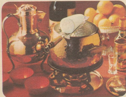
Krambambuli. Stöckli-Modelle: Bowle mit Deckel 7745, Fr. 73.50, Réchaud 7531, Fr. 27.50, Zange 7973, Fr. 16.-