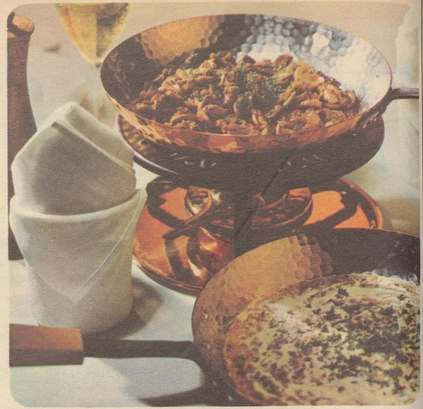
Geschneitzeltes mit Rösti. Stöckli-Modelle: Flambierpfanne rund Nr. 7761, Fr. 36.90, Réchaud Nr. 7531, Fr. 27.50.