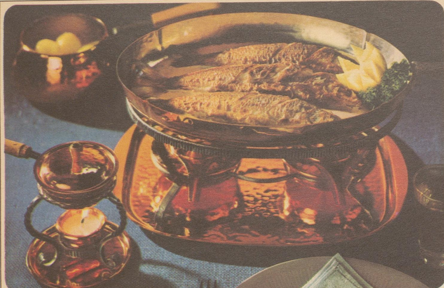
Felchen «Seestern». Stöckli-Modelle: Flambierpfanne oval Nr. 7771, Fr. 55.-, Réchaud mit Tablett Nr. 7569, Fr. 80.50, Saucenwärmer Nr. 7575, Fr. 29.90, Burgunder-Pfanne mit Deckel Nr. 7705, 14 cm, Fr. 34.50.