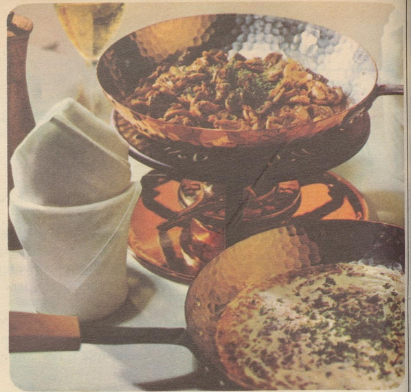
Geschneitzeltes mit Rösti. Stöckli-Modelle: Flambierpfanne rund Nr. 7761, Fr. 36.90, Réchaud Nr. 7531, Fr. 27.50.