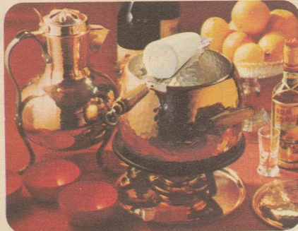
Krumbambuli. Stöckli-Modelle: Bowle mit Deckel 7745, Fr. 73.50, Réchaud 7531, Fr. 27.50, Zange 7973, Fr. 16.-