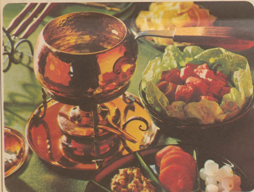
Fondue Bourguignonne. Stöckli-Modelle: Burgunder-Pfanne mit Deckel Nr. 7705, 18 cm, Fr. 44.-, Réchaud Nr. 7545, Fr. 42.50, Gestell mit 6 Spiessen Nr. 7961/63, Fr. 39.40.