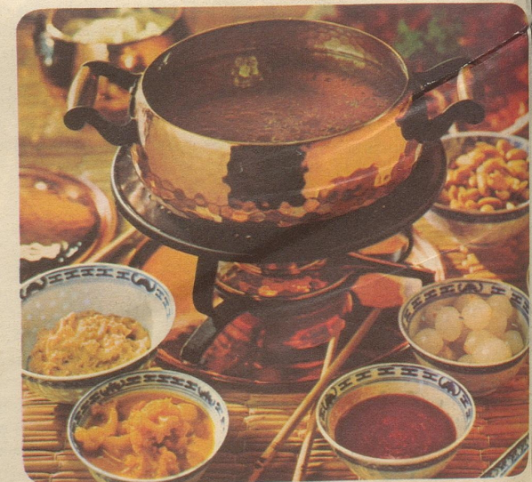
Fondue Chinoise. Stöckli-Modelle: Servierkasserolle mit Deckel Nr. 7803, Fr. 43.50, Réchaud Nr. 7531, Fr. 27.50.