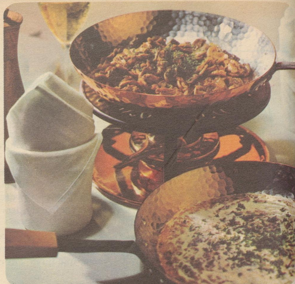
Geschneitzeltes mit Rösti. Stöckli-Modelle: Flambierpfanne rund Nr. 7761, Fr. 36.90, Réchaud Nr. 7531, Fr. 27.50.