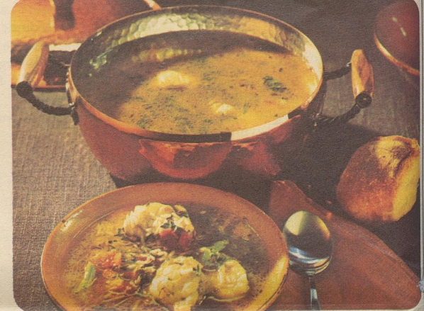
Fischsuppe «Paradiso». Stöckli-Modelle: Pot-au-feu mit Deckel Nr. 7835, Fr. 71.-.