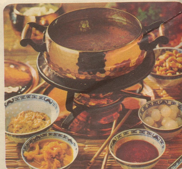
Fondue Chinoise. Stöckli-Modelle: Servierkasserolle mit Deckel Nr. 7803, Fr. 43.50, Réchaud Nr. 7531, Fr. 27.50.