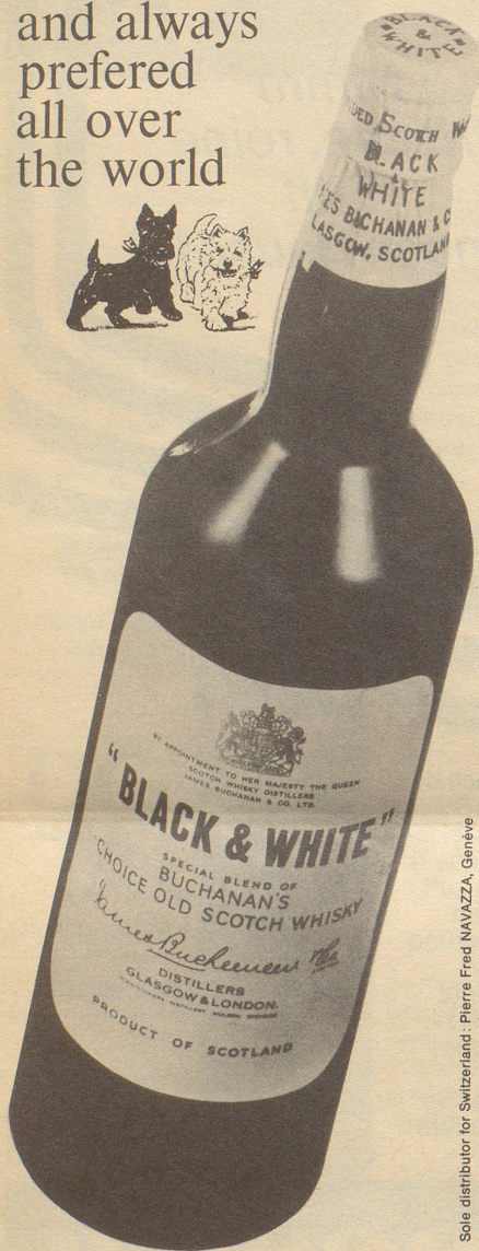
Sole distributor for Switzerland: Pierre Fred NAVAZZA, Genève