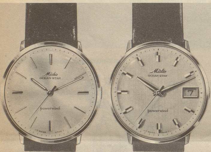
15001 Ocean Star Stahl Fr. 262.- Goldplaqué Fr. 298.- Mit Kalender Fr. 282.-/345.- 55007 Ocean Star Datometer Stahl Fr. 298.- Goldplaqué Fr. 360.- 18 Kt. Gold Chronometer Fr. 745.-