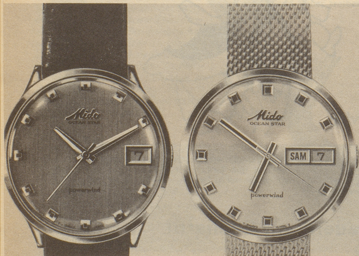
25057 Ocean Star Datometer Stahl Fr. 298.- Goldplaqué Fr. 360.- 5069-MI Ocean Star Datoday zeigt Wochentag und Datum Stahl Fr. 385.- Goldplaqué Fr. 455.-