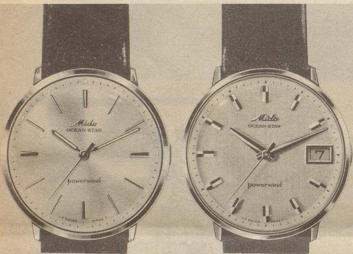
15001 Ocean Star Stahl Fr. 262.- Goldplaqué Fr. 298.- Mit Kalender Fr. 282.-/345.- 55007 Ocean Star Datometer Stahl Fr. 298.- Goldplaqué Fr. 360.- 18 Kt. Gold Chronometer Fr. 745.-