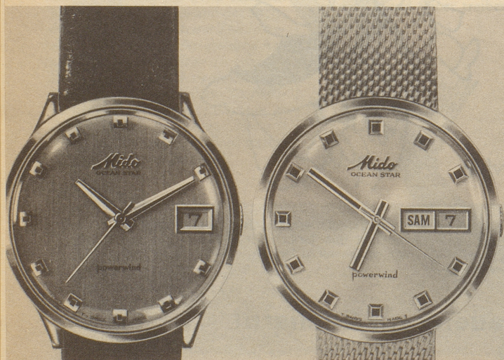
25057 Ocean Star Datometer Stahl Fr. 298.- Goldplaqué Fr. 360.- 5069-MI Ocean Star Datoday zeigt Wochentag und Datum Stahl Fr. 385.- Goldplaqué Fr. 455.-

Der Direktor der Ilias-Film GmbH saß hinter seinem Schreibtisch.