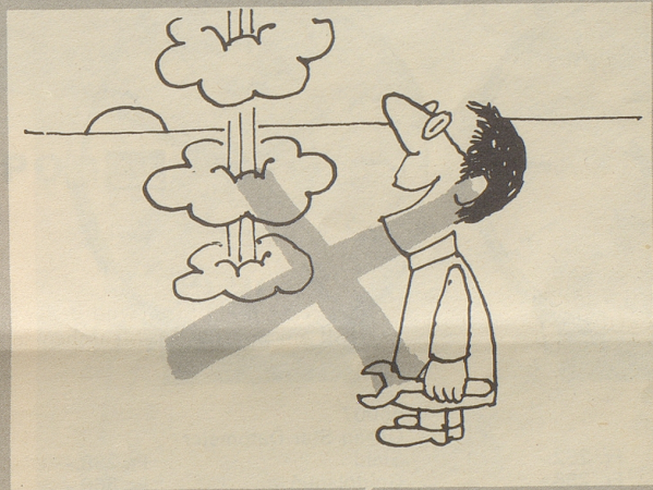
Das Studium wissenschaftlicher Bücher kann dazu führen, daß unsere jungen Forscher vom rechten Weg abkommen. Das wollen wir nicht! Wir wollen nicht, daß unsere Wissenschaftler etwas erfinden, das es noch nicht gibt!