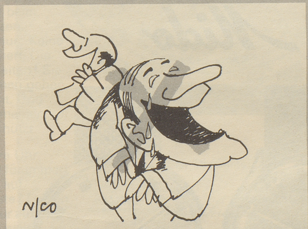
Die Konsumation von Humorbüchern ist schon deshalb gefährlich, weil man manchmal das Gesicht verziehen muß. Das wollen wir nicht! Wir wollen nicht lachen – wir sind seriöse Schweizer!

Wir fordern: noch mehr Steuern auf Büchern!