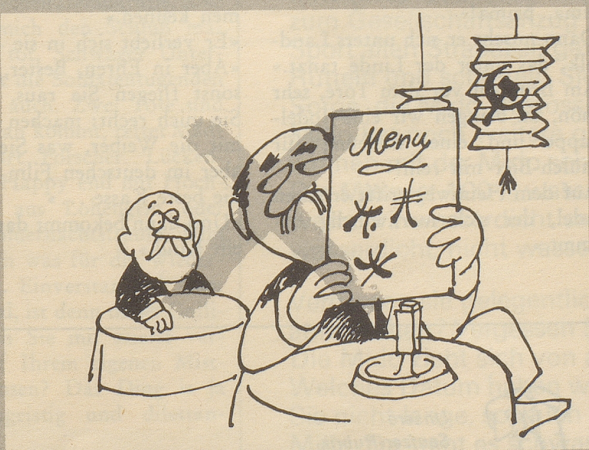
Das Blättern in Kochbüchern kann uns die Erkenntnis bringen, daß es außer Rösti und Bratwürsten auch noch griechische, dänische, französische, chinesische usw. Gerichte gibt. Das wollen wir nicht! Wir wollen keine Schwalbennestersuppe, wir sind keine Kommunisten!