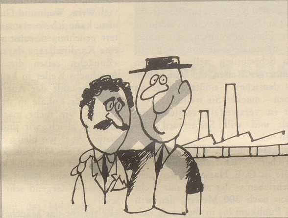
Das Lesen von Reisebüchern kann dazu führen, daß wir das Leben fremder Völker kennen und verstehen lernen. Das wollen wir nicht! Wir haben uns daran gewöhnt, Italiener nicht zu mögen!

Wohin zügelloses Lesen führen kann, zeigt unser Bildbericht.