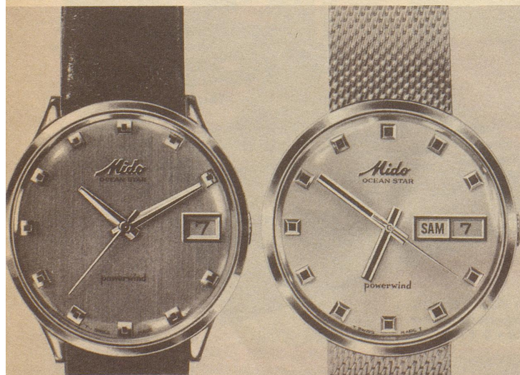
25057 Ocean Star Datometer Stahl Fr. 298.- Goldplaque Fr. 360.- 5069-MI Ocean Star Datoday zeigt Wochentag und Datum Stahl Fr. 385.- Goldplaque Fr. 455.-