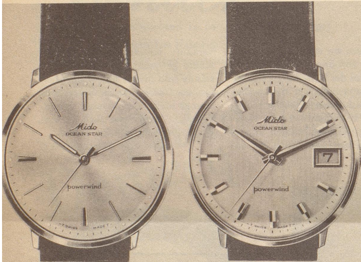
15001 Ocean Star Stahl Fr. 262.- Goldplaqué Fr. 298.- Mit Kalender Fr. 282.-/345.- 55007 Ocean Star Datometer Stahl Fr. 298.- Goldplaqué Fr. 360.- 18 Kt. Gold Chronometer Fr. 745.-