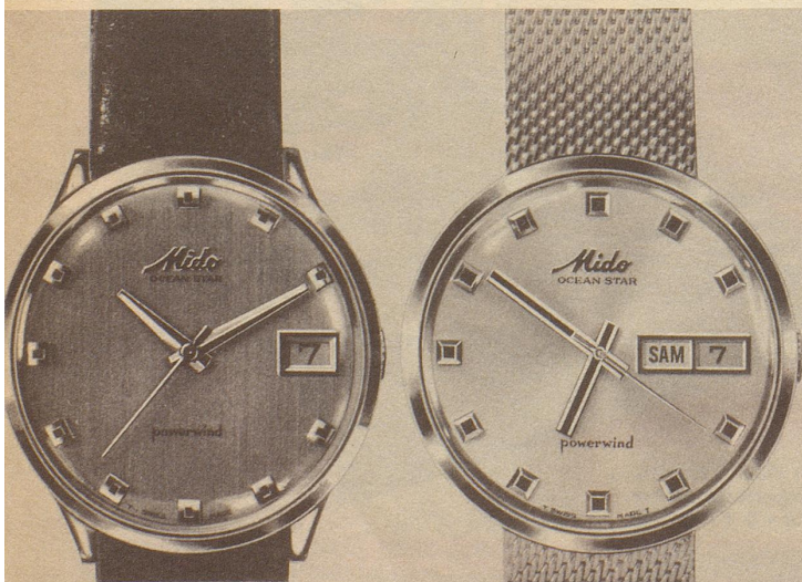
25057 Ocean Star Datometer Stahl Fr. 298.- Goldplaqué Fr. 360.- 5069-MI Ocean Star Datoday zeigt Wochentag und Datum Stahl Fr. 385.- Goldplaqué Fr. 455.-