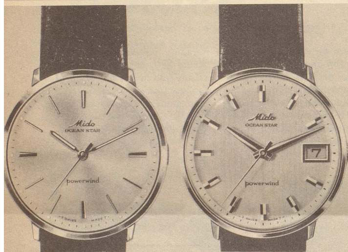
15001 Ocean Star Stahl Fr. 262.- Goldplaque Fr. 298.- Mit Kalender Fr. 282.-/345.- 55007 Ocean Star Datometer Stahl Fr. 298.- Goldplaque Fr. 360.- 18 Kt. Gold Chronometer Fr. 745.-