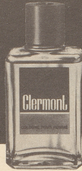
Clermont et Fouet Genève