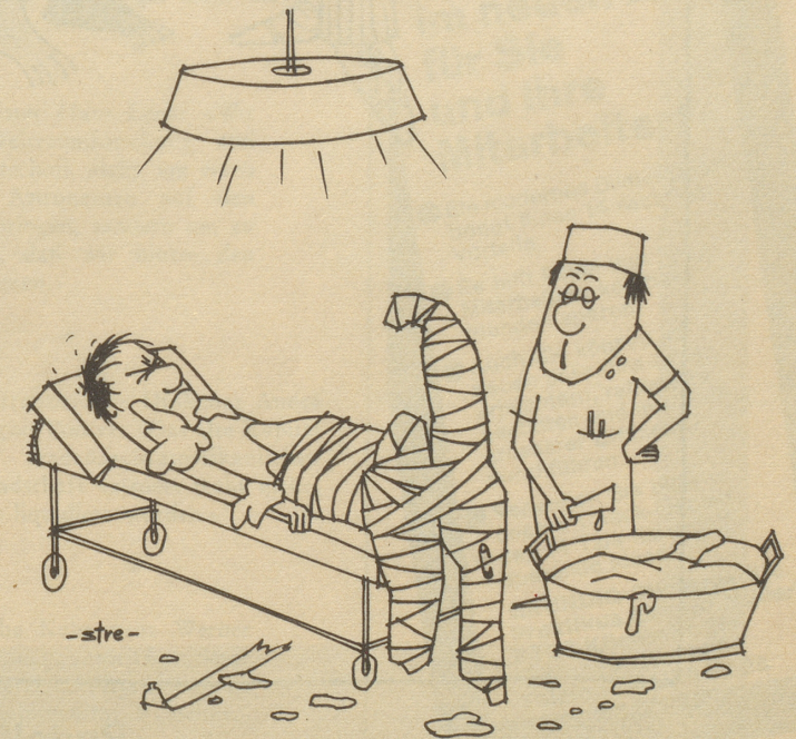
« Es ist ja schließlich auch meine erste Gipsarbeit! »