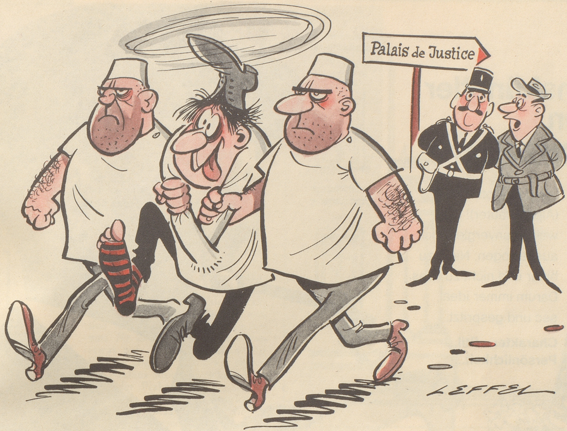
Ben Barka-Prozeß «Schon wieder einer, der die wahren Hintergründe dieser Affäre aufdecken wollte!»