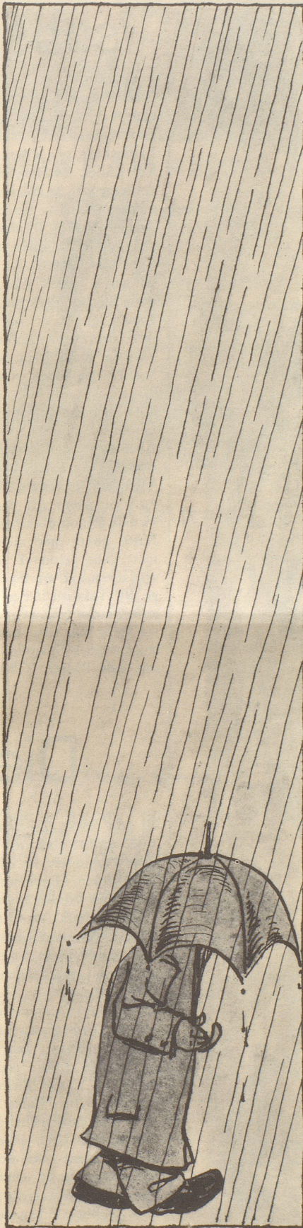
« Ist das ein schlechtes Wetter! »