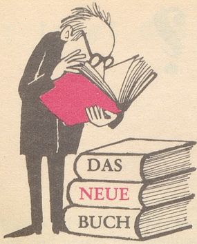
«Hitler in der Karikatur der Welt»