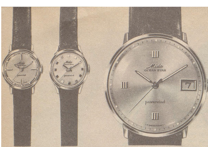
001 Lady Ocean Star Stahl Fr. 288.- Goldplaque Fr. 298.- 26021 Lady Ocean Star Stahl Fr. 295.- Goldplaque Fr. 298.- 18 Kt. Gold Fr. 495.-