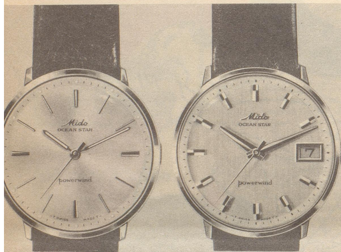
5001 Ocean Star Stahl Fr. 262.- Goldplaque Fr. 298.- mit Kalender Fr. 282.-/345.- 55007 Ocean Star Datometer Stahl Fr. 298.- Goldplaque Fr. 360.- 18 Kt. Gold Chronometer Fr. 745.-