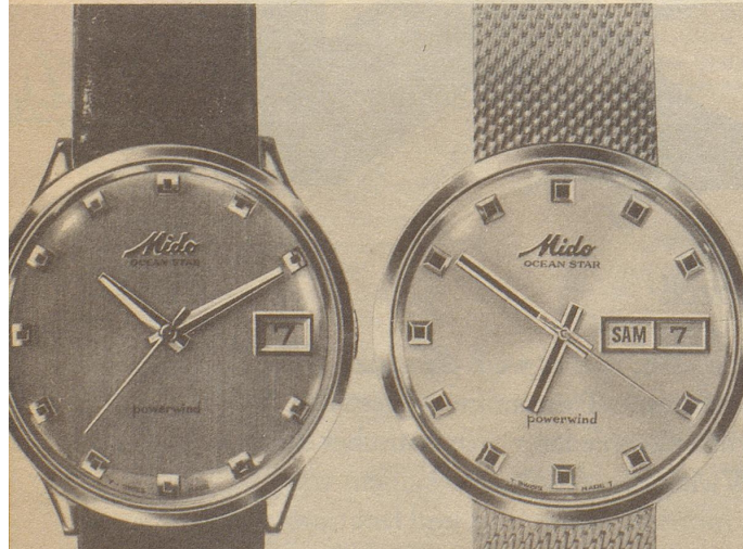
5057 Ocean Star Datometer Stahl Fr. 298.- Goldplaque Fr. 360.- 5069-MI Ocean Star Datoday zeigt Wochentag und Datum Stahl Fr. 385.- Goldplaque Fr. 455.-