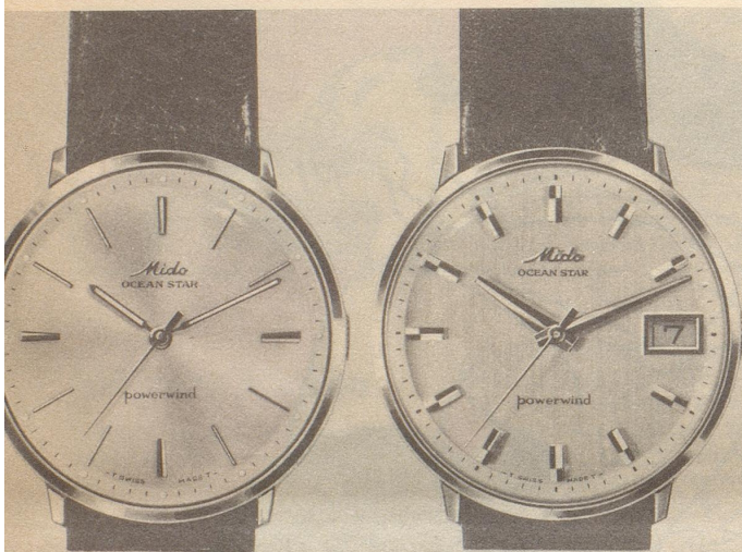
5001 Ocean Star Stahl Fr. 262.- Goldplaque Fr. 298.- Mit Kalender Fr. 282.-/345.-