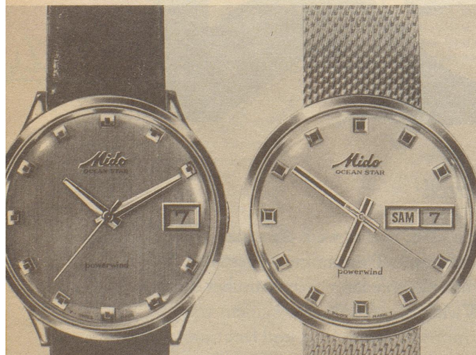
5057 Ocean Star Datometer Stahl Fr. 298.- Goldplaque Fr. 360.- 5069-M1 Ocean Star Datoday zeigt Wochentag und Datum Stahl Fr. 385.- Goldplaque Fr. 455.-