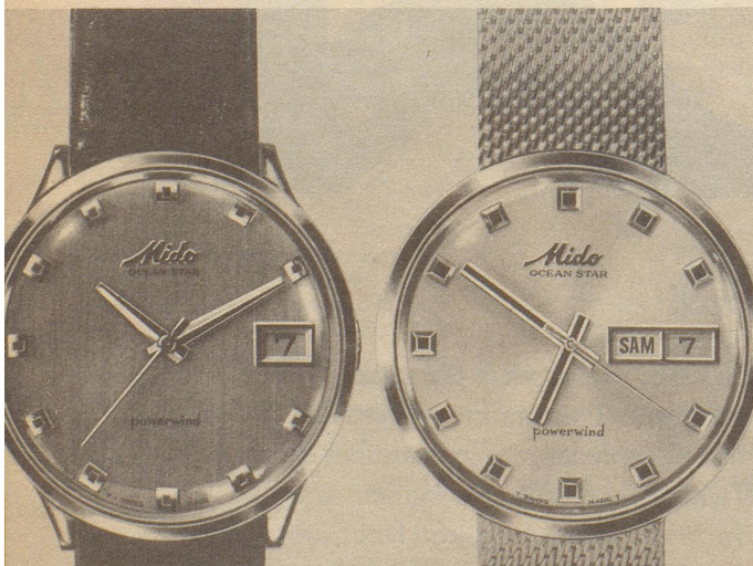
5057 Ocean Star Datometer Stahl Fr. 298.- Goldplaque Fr. 360.-