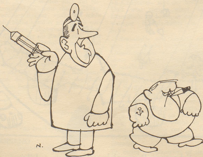
Gestärkt in die Heimat zurück

Die terroristischen Unternehmen der «Roten Garde» und ihre Kultur-revolution wurden vorübergehend gestoppt. Die Burschen wurden aufgefordert, sofort in die Volkskommunen zu gehen und beim Einbringen der Ernte zu helfen. Da die Revolution offenbar nicht immer vom Kinderfressen leben kann, schickt sie ihre Kinder zurück auf die Felder.