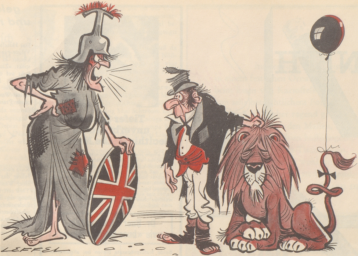
Britische Austerität «Und als neue Hymne schlage ich vor: God save the Pound!»