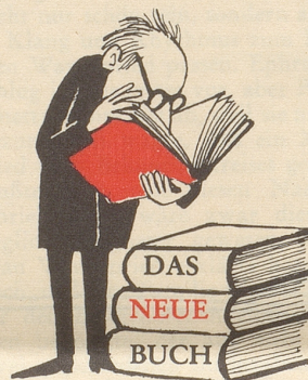
«Q. N. wußte Bescheid»

Jüngst machte die amtliche Beschlagnahme von Akten von sich reden, von Akten, die von einem eben verstorbenen Journalisten und ehemaligen schweizerischen Nachrichtenmann stammen und sich im Besitze des Publizisten Kurt Emmenegger befanden, der seinerseits jedoch schon im vergangenen Jahr nicht nur Teile dieser Akten in einer Tageszeitung, sondern die Artikelfolge in Buchform veröffentlicht hat: im 134seitigen Buche