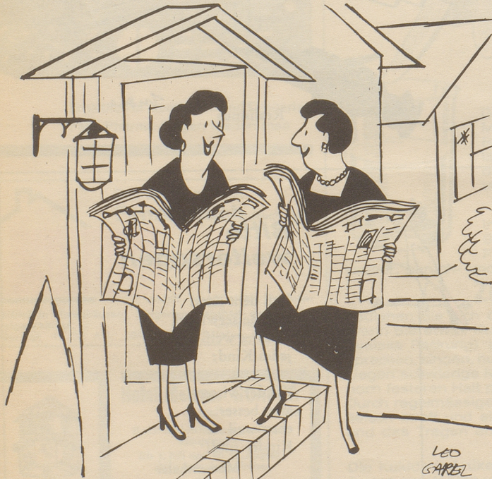
«Da muß irgendwo ein toller Ausverkauf sein — Mein Mann hat auch die Seite 9 herausgerissen!»

Muggeridge sagte: «Alle Zeichnungen, alle Artikel können nie humorvoll sein. Eine humoristische Zeitschrift erfüllt ihre Aufgabe nur, wenn sie niemals den Humor verliert. Wir sind nicht immer witzig, aber nie witzlos ...» B. K.