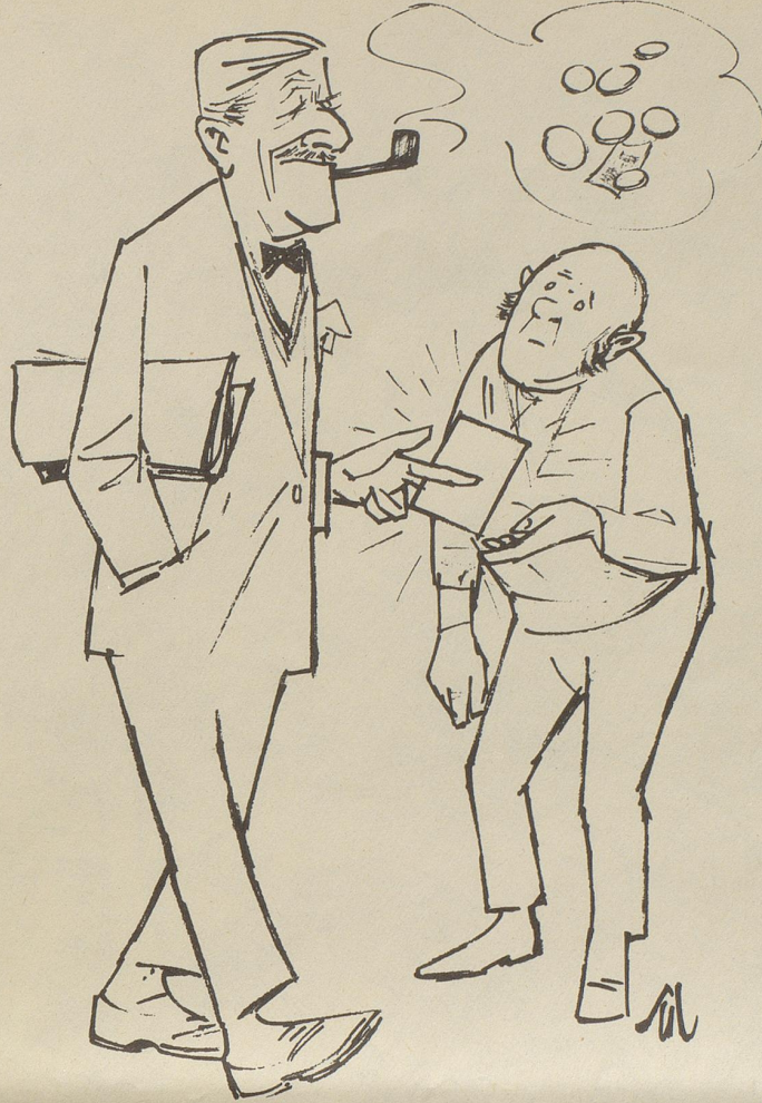
Gegner der Trinkgeld-Gewohnheiten in England haben ein Kärtchen mit Dankesworten herausgegeben, das an Stelle eines Geldbetrages überreicht werden soll.

Mein Traum wäre es, Bertons Vertrauter zu werden. Aber ich habe Angst, daß er mich verachtet, weil ich klein bin.