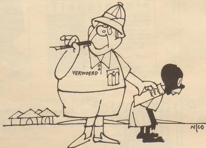
Dankschreiben an den Haager Gerichtshof

Lakonische Karte eines Freundes: «Lokale Regenschauer, Regen schauert lokal, schaurige lokale Regen, lokale Schauerregen, schauriges Regenlokal!»