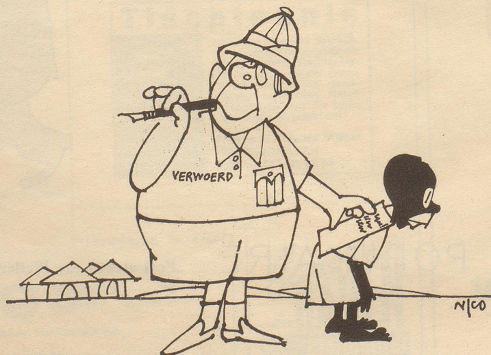
Dankschreiben an den Haager Gerichtshof