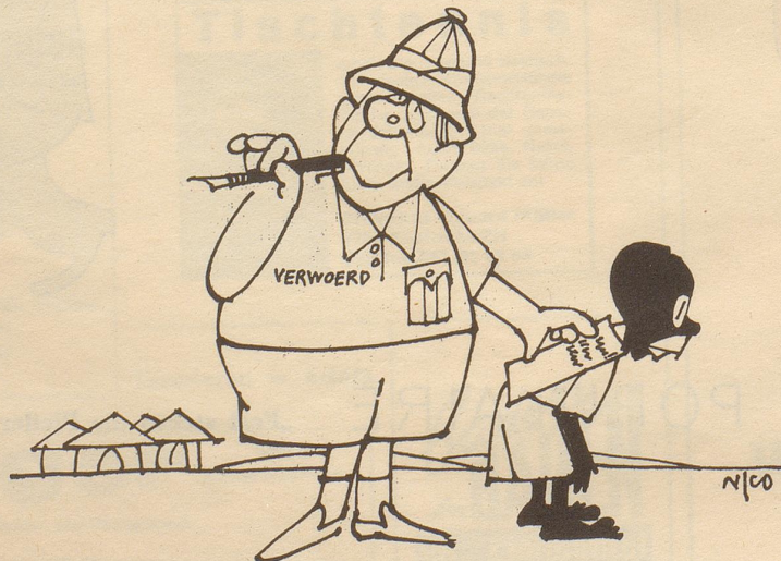
Dankschreiben an den Haager Gerichtshof

Lakonische Karte eines Freundes: «Lokale Regenschauer, Regen schauert lokal, schaurige lokale Regen, lokale Schauerregen, schauriges Regenlokal!»