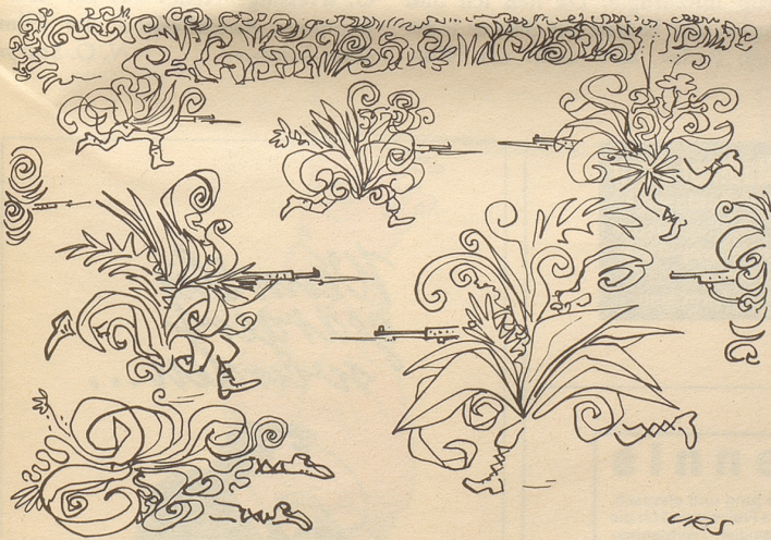
Vietnam: Dschungel in Bewegung