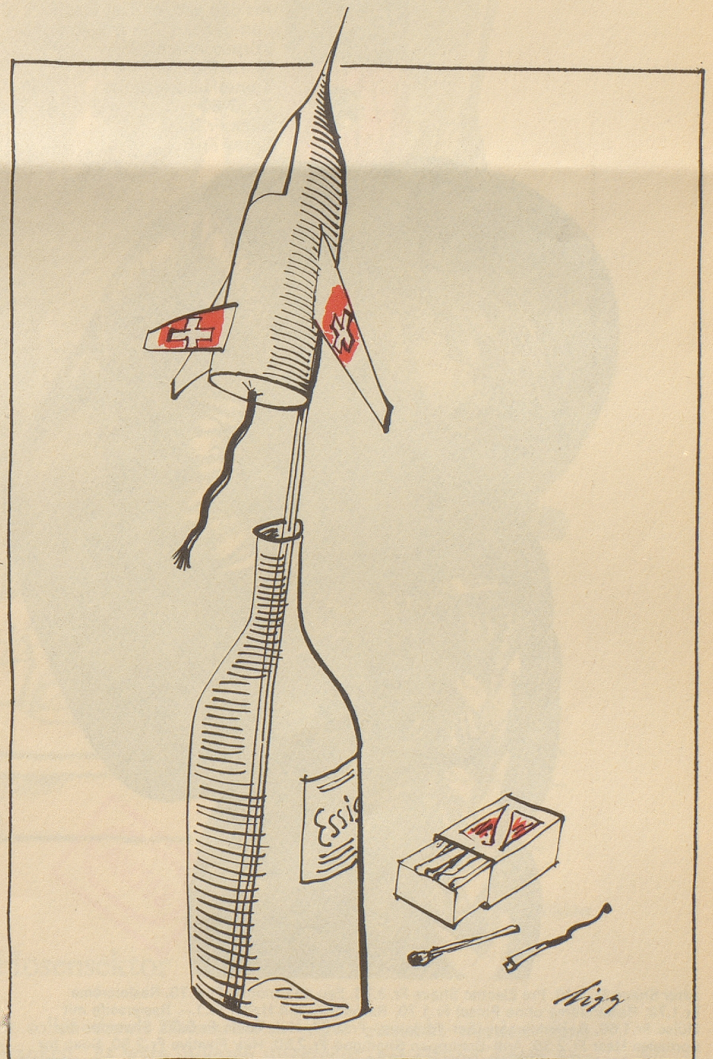
Das neue Überschall-Knallwerk für den 1. August