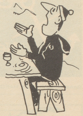
Sie sind schwer wie Zementblöcke . . .