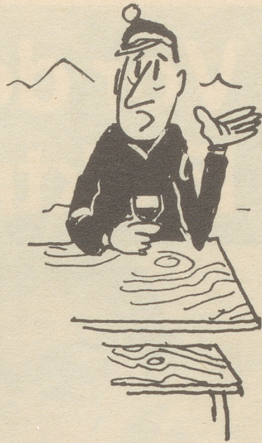
. . . was man heute für Skischuhe trägt!