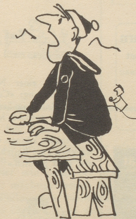
nicht in klotzige Schuhe gezwängt . . .