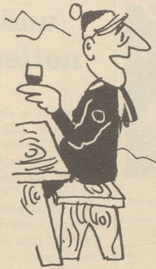
Man kann kaum mehr gehen darin . . .