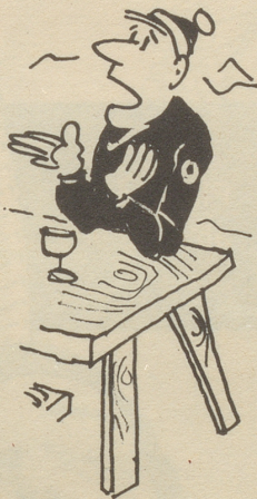
Man sollte beweglich sein,