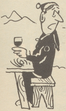
«Einfach unglaublich . . .