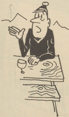
Dabei ist Skifahren doch ein graziöser Sport . . .