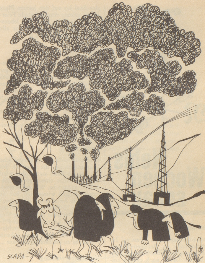
Mit Oel betriebene thermische Kraftwerke stoßen mit dem Rauchgas Schwefeldioxyd ab, das für Menschen, Tiere und Pflanzen schädlich ist.