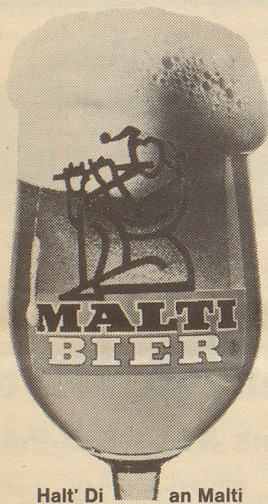
Halt' Di an Malti

MALTI-Brauerei der OVA Affoltern a. Albis Tel. 051 99 55 33