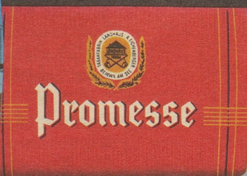
Promesse, eine natürlich duftende, wirklich milde English-Mixture