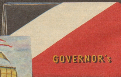
Governor's, eine herrlich duftende amerikanische Mischung im Holländer-Schnitt

Tabakfabrik Landhaus, A. Eichenberger & Co, Beinwil a/See