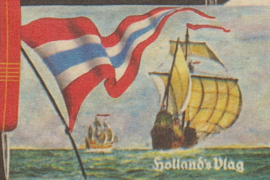
Holland's Vlag, der Holländer-Tabak moderner Prägung — ein Cavendish-Tabak