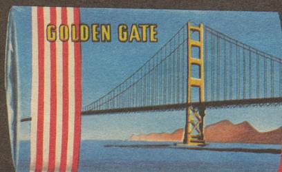
Aromatische Amerikaner-Mischung von internationalem Niveau