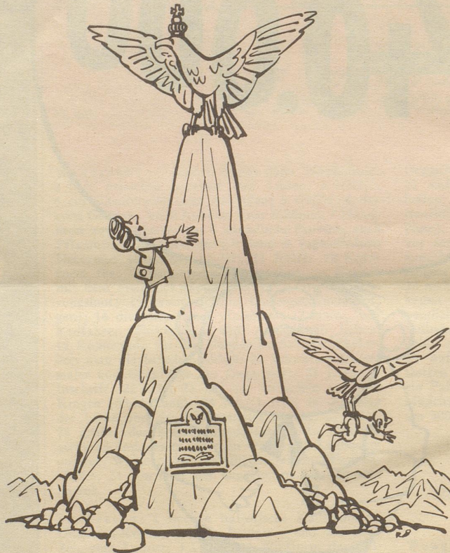
«Geshch Kari i ha rächt gha: es isch ke läbige!»

Das Heimatmuseum Rorschach zeigt vom 8. Mai bis 5. Juni 1966 Bilder aus dem Nebelspalter