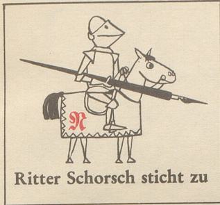
Ritter Schorsch sticht zu