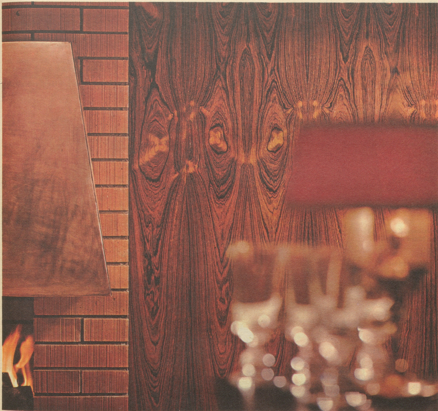
Wandelement aus südamerikanischem Palisander