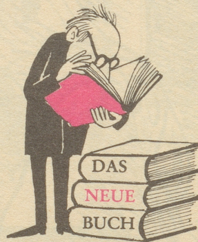
Alles schon dagewesen!

In der Reihe der «Facsimile Querschnitte» durch alte Zeitungen und Zeitschriften, in welcher bisher (im Scherz Verlag Bern) schon Bände erschienen sind über «Gartenlaube», «Simplicissimus», «Kladderadatsch» u. a., liegt nun ein Querschnitt durch die von Ullstein 1891 erstmals herausgegebene «Berliner Illustrierte Zeitung» vor.